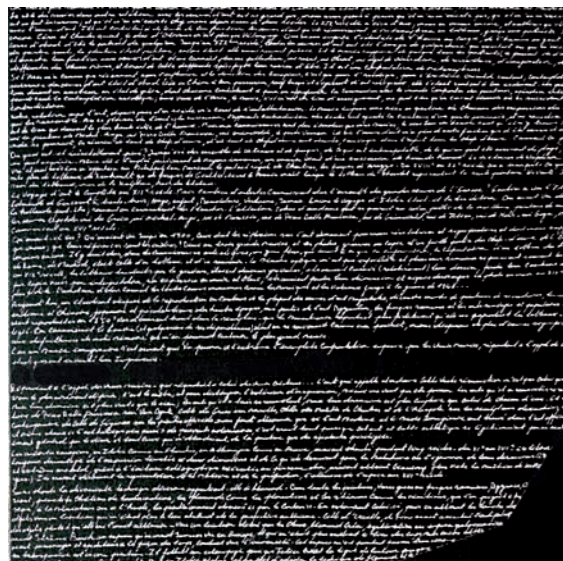
LE MUSÉE IMAGINAIRE A. Malraux / Encre de chine, encre gel, vernis sur toile / 100X65 . 2006