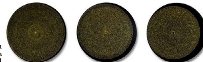
LE TERRIER d'après Le Terrier F. Kafka Encre de chine, encre gel, vernis sur toile / 3 ronds 50x50 . 2011